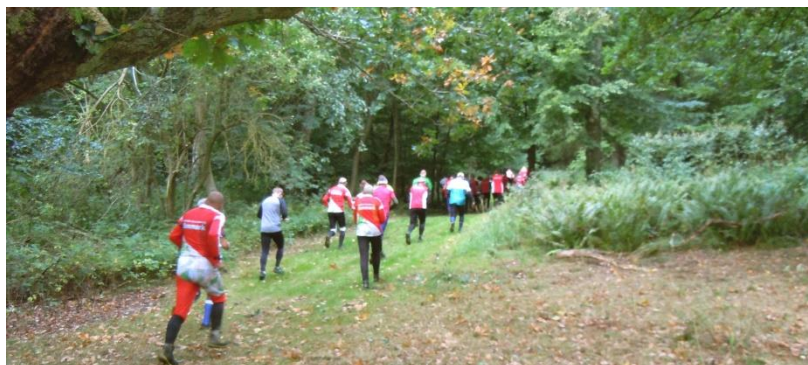
Samlet start i stafet - på vej i skoven